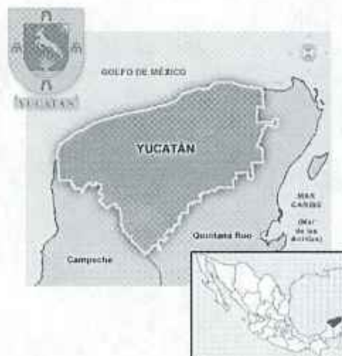
Ilustración 1 - Macro localización de cobertura del Programa.

Con base al artículo 3 del Decreto 165/2014, la cobertura abarcará los 106 municipios del estado de Yucatán: