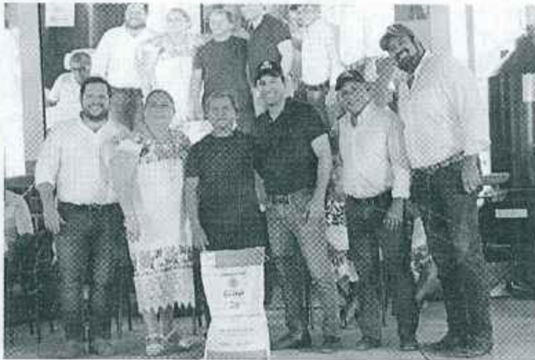
REUNIÓN DE TRABAJO EN LA SECRETARÍA DE DESARROLLO RURAL